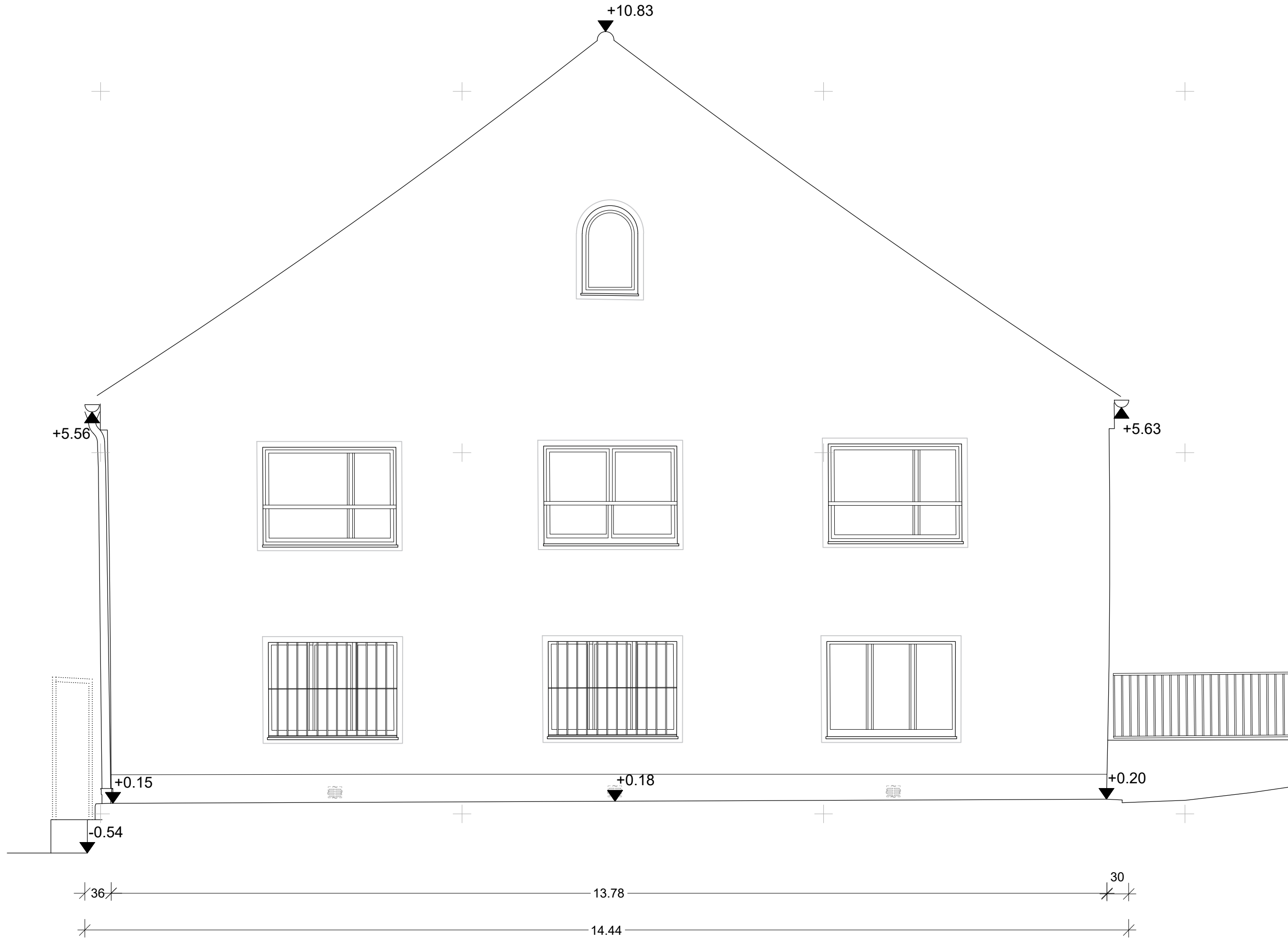
Ansicht West, M 1:50